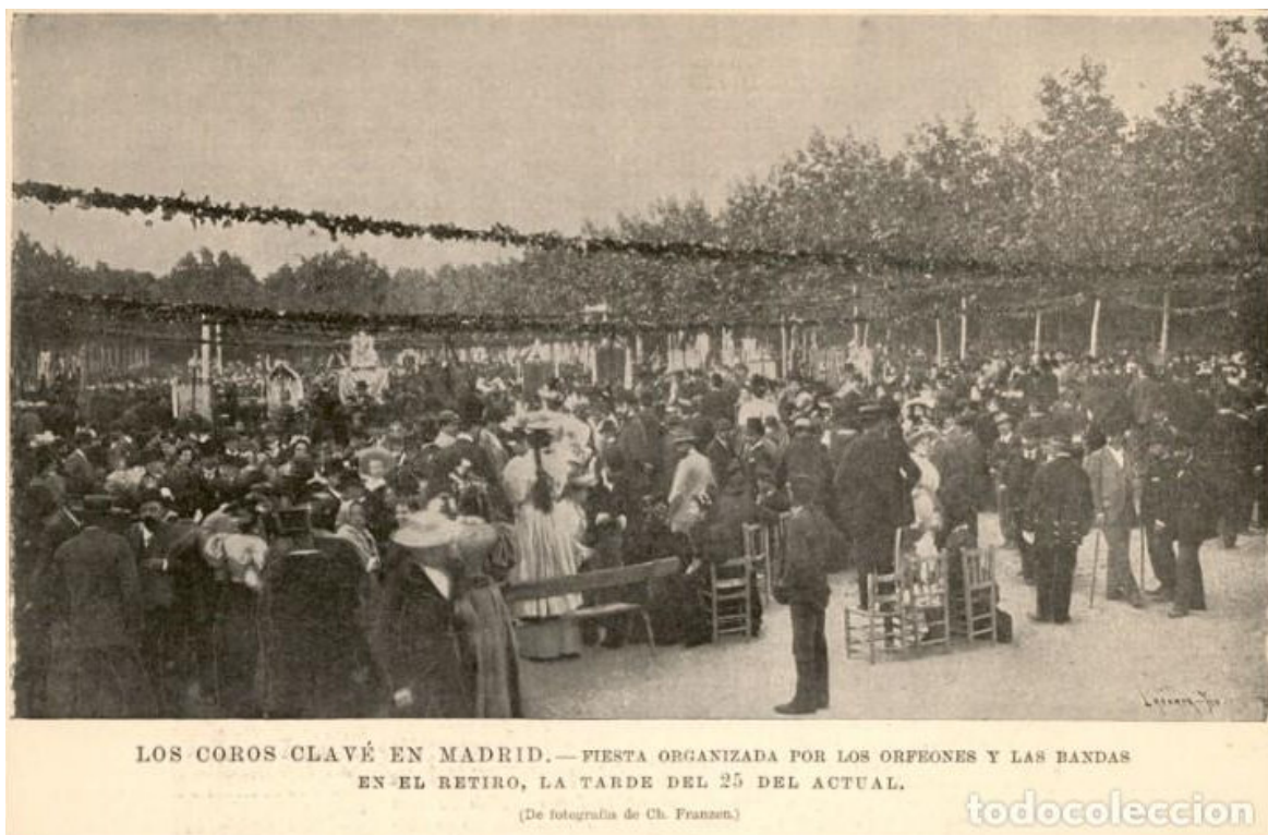
El Retiro 25/05/1896. Fotografia extreta d'Internet

Es van desplaçar vuitanta-una associacions corals amb un total d'uns mil sis-cents coristes. A més de la nostra, altres corals del nostre entorn que hi van anar van ser les de Tarragona, Reus, Falset, Capçanes i Torroja, entres altres. Les cròniques de l'època descriuen unes vetllades espectaculars al Retiro.